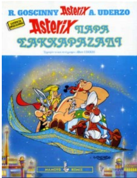
Bandes dessinées / BD

Mis en ligne par Arrête Ton Char !, le 2 février 2007 (dernière m.a.j. : 28 février 2018)