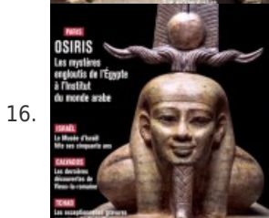
16. Archéologia #535 – Osiris : les mystères engloutis de l'Égypte