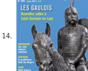
14. Les Gaulois, nouvelles salles à Saint-Germain-en-Laye