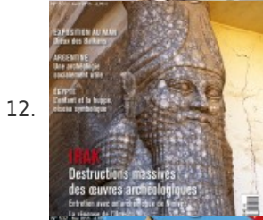
12. MAGAZINE • Irak : destructions massives des œuvres archéologiques – Archéologia #531