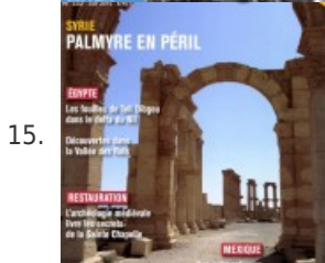
15. MAGAZINE • Palmyre en péril – Archéologia #533