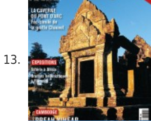
13. MAGAZINE • Splendeur des bronzes hellénistiques – Archéologia #532