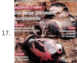
17. Archéologia #537 • Découverte à Pompéi : une tombe préromaine exceptionnelle