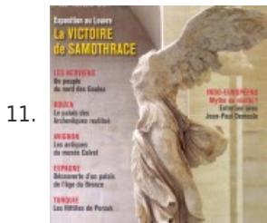
11. La Victoire de Samothrace : exposition au Louvre – Archéologia #530