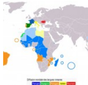
Les langues romanes dans le monde.