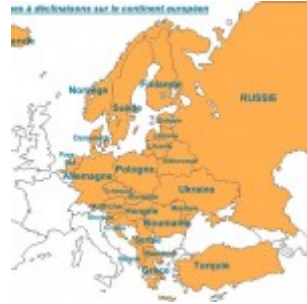
Carte européenne des langues à déclinaison (en orange).