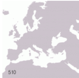
Carte de l'expansion de l'empire romain.