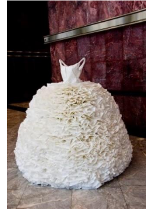
Robe en papier crépon Création Susan Stockwell

Inspirés du conte Amour et Psyché , les costumes chercheront également à évoquer les réalisations des grands couturiers : toutes les exubérances seront donc de mise pour incarner les héros d'Apulée !