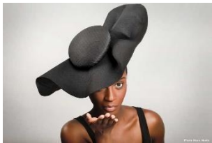
Chapeau en papier crépon Création ATS Evénement