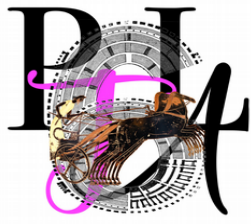
TABLEAU DES LECTURES : Sélection : Albums CE1-CE2 - Classe : .....