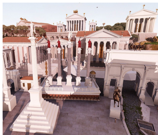
Vue du Forum romain, issue du Plan de Rome virtuel (CIREVE, Unicaen)