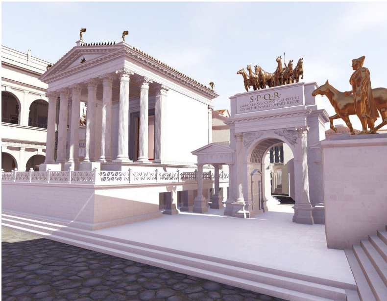
Vue du Forum romain, issue du Plan de Rome virtuel (CIREVE, Unicaen)

Week-end inaugural : cette exposition sera inaugurée à l'occasion des Journées Européennes de l'Archéologie le samedi 14 et le dimanche 15 juin.