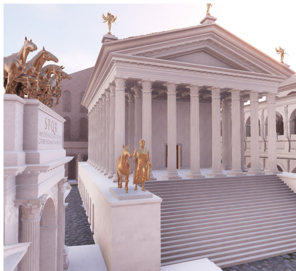
Vue du temple de Castor et Pollux, issue du Plan de Rome virtuel (CIREVE, Unicaen)