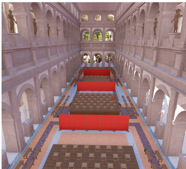
Vue de l'intérieur de la Curie Julienne, issue du Plan de Rome virtuel (CIREVE, Unicaen)

Lors des visites commentées, les visiteurs seront guidés dans le modèle virtuel complet du Plan de Rome. Tous les quartiers et monuments restitués par l'équipe de recherche de Caen seront alors accessibles !