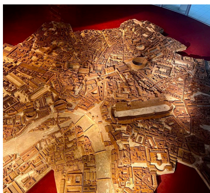
Vue de la maquette de Paul Bigot, issue du Plan de Rome virtuel (CIREVE, Unicaen)

Exposition en accès libre de 10h à 18h ; accès gratuit au musée et aux animations