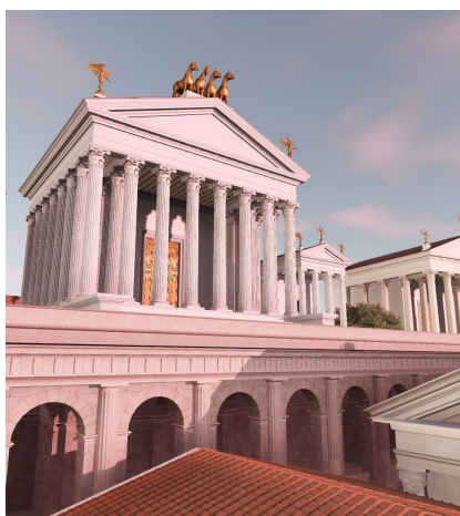
Vue du temple de Junon Moneta, issue du Plan de Rome virtuel (CIREVE, Unicaen)

Une maquette interactive, constituée d'impressions 3D de monuments romains permettra au public de s'amuser à reconstituer le Forum romain et à créer sa propre ville de Rome, tout en comprenant le rôle des différents monuments constitutifs de la ville.