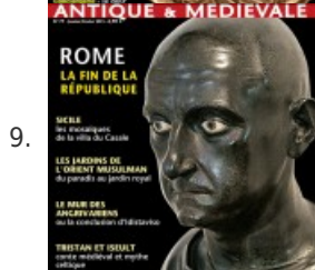
9. Rome, la fin de la République - Histoire Antique & Médiévale #77