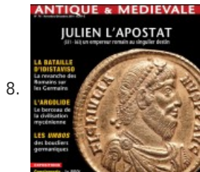
8. Julien l'Apostat