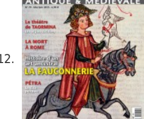
12. MAGAZINE • La fauconnerie, le théâtre de Taormine et la mort à Rome - Histoire antique & médiévale