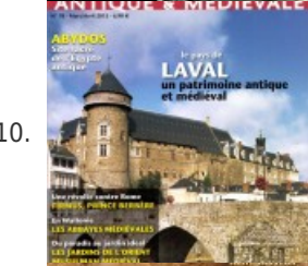
10. Le pays de Laval, un patrimoine antique et médiéval - Histoire antique & médiévale #78