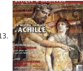
13. Histoire Antique & Médiévale #82 - Le mythe d'Achille