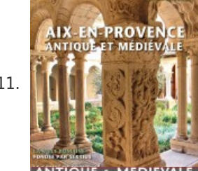
11. Aix-en-Provence, antique et médiévale - Histoire Antique & Médiévale HS #42