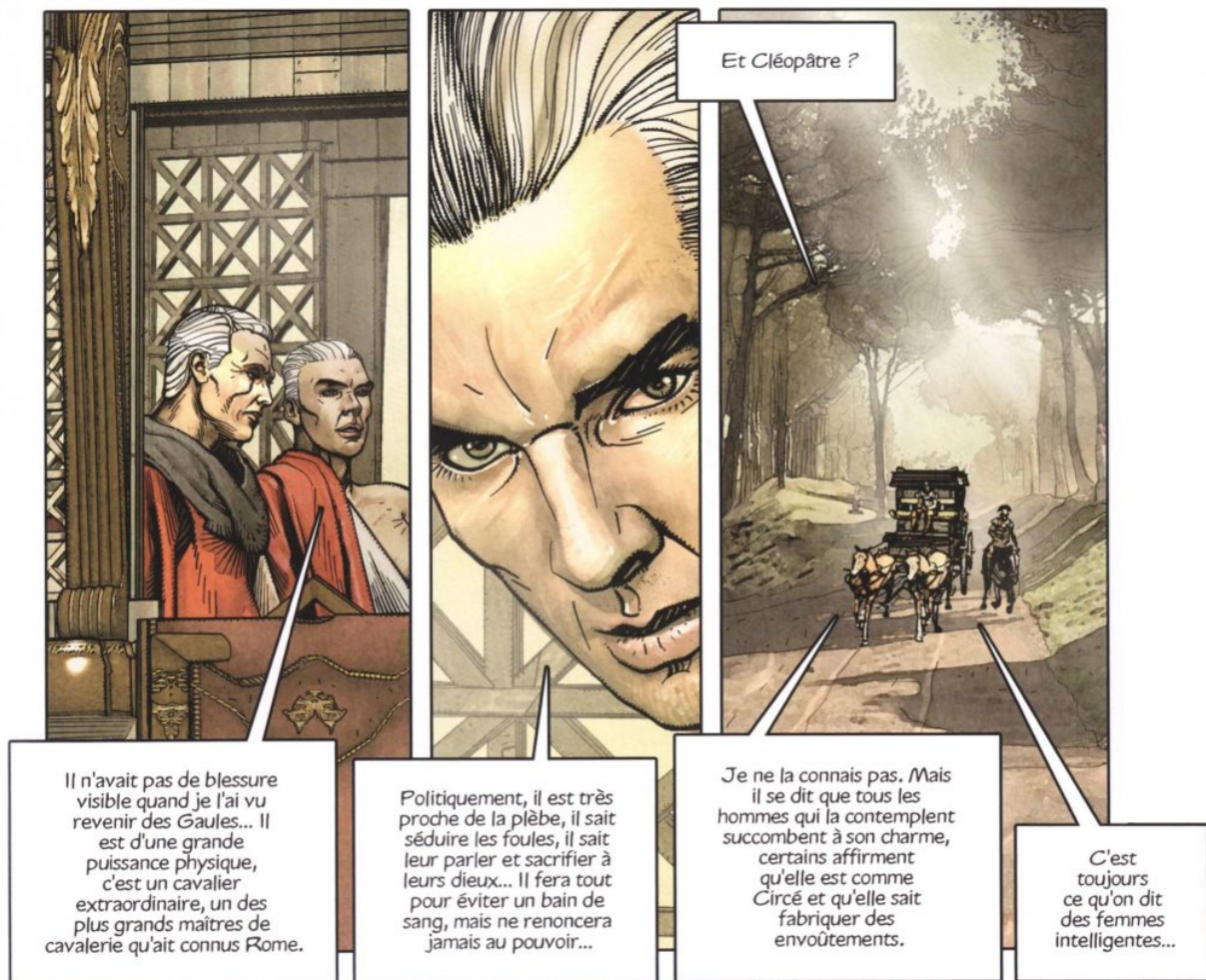
Brutus fait le portrait d'Antoine et de Cléopâtre à César (extrait de la planche 11)