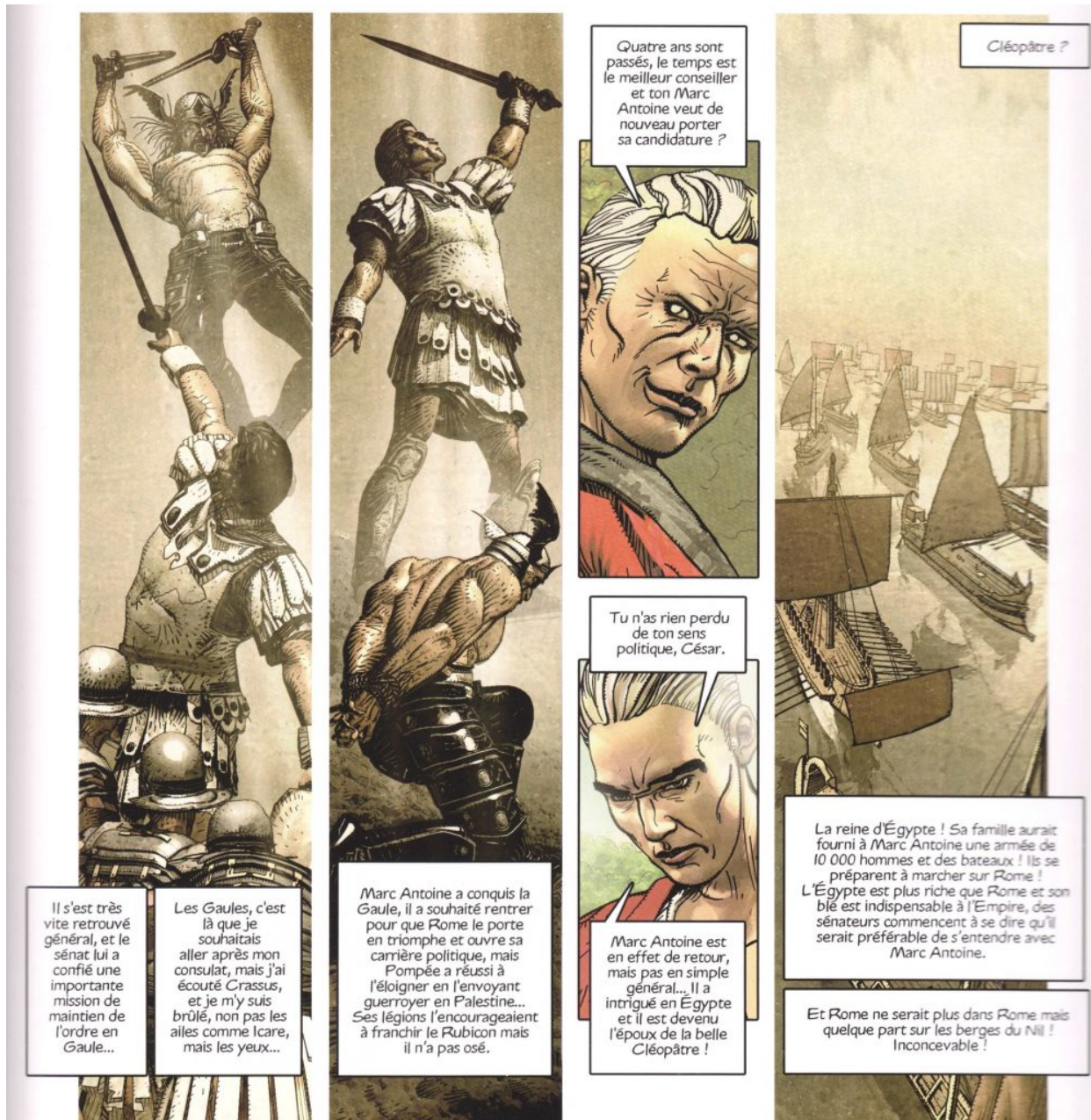
Extrait de la planche 5 (ne vous fiez pas à la qualité du scan !)

(nommé par le Sénat), et Antoine, vainqueur des Gaules qui s'est refusé à franchir le Rubicon (au sens propre, d'abord), est installé en Égypte, dans les bras de Cléopâtre, après avoir été envoyé par Pompée en Palestine — l'objectif n'était autre que de l'éloigner.