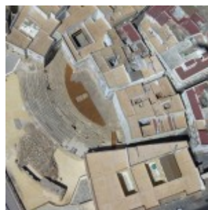
Vue aérienne du théâtre romain de Cadix et des monuments qui l'entourent et le recouvrent