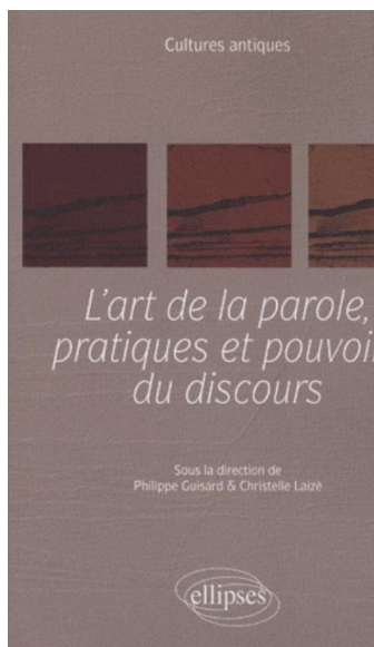
L'art de la parole, pratiques et pouvoirs du discours → page de l'éditeur