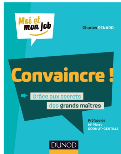
Convaincre ! Grâce aux secrets des grands maîtres [antiques] → page de l'éditeur